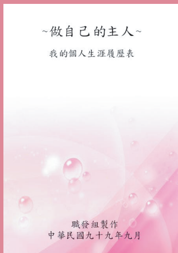
範本 / 履歷表封面

除了一般的紙本履歷表列印功能之外，也可透過不同的履歷表封面、格式設計，增添個人化的品味，提高未來畢業之職場競爭力！