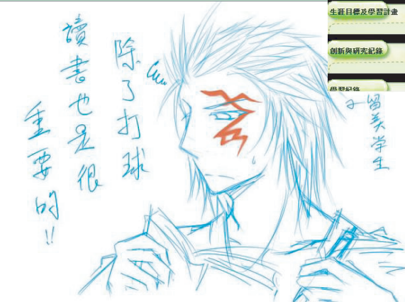
黃泉哥哥如果用這種表情教我讀書的話，就宣佈全部都不會我也完全不在意!!! (鼻血快：哥哥你快讀! (聞) (驚恐))

可上傳自我作品，增加個人特色透過個人作品的上傳，展現出文化學生在學習之外的個人嗜好及專長，而其它同學也可給予作品鼓勵及反應，使作者更具成就感。