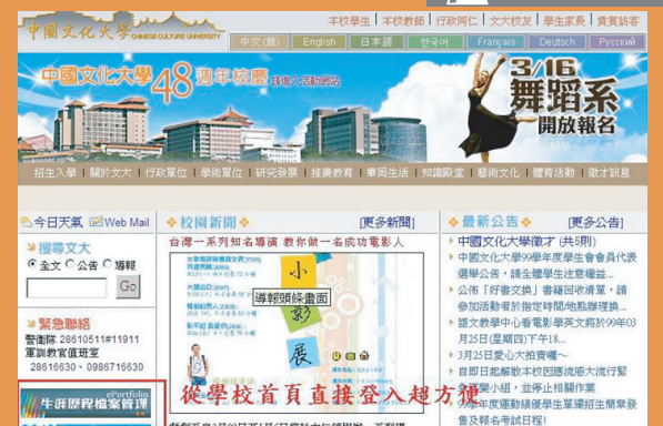
從學校首頁直接登入超方便

不論是透過本校首頁進入生涯歷程檔案平台，或者是透過學生專區登入，都可以透過單一的流程，讓操作更為簡便。