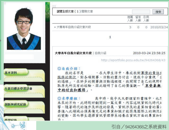
引自 / 94264368之系統資料

自我介紹格式條理分明，脈絡清楚依照系統中的預設格式畫面，使同學們在撰寫自我履歷時，更加條理分明，輔以個人照片的呈現，使一般閱讀起來平淡無奇的自傳，也可以變的更加生動活潑哦！